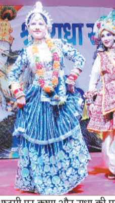
राधा अष्टमी पर कृष्ण और राधा की प्रस्तुत झांकी एवं उपस्थित नगरवासी।