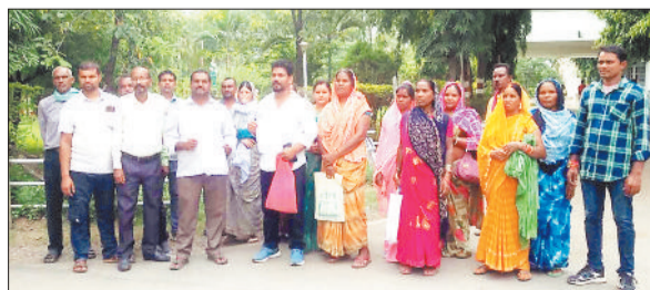
कलेक्ट्रेट पहुंचे गोढ़ी पंचायत के प्रतिनिधि।

पूर्व कांग्रेस सरकार के द्वारा ग्रामीण अंचलों में बनाए गए गौठान अब बेजा कब्जा की भेंट चढ़ते जा रहे हैं। गौठानों की सामनों की चोरी होने के बाद न तो उसकी शिकायत की गई है और न उसके खरखाव के लिए कोई कार्ययोजना बनी है। ऐसे गौठान अब बेजा कब्जा के भेंट चढ़ते जा रहे हैं। जिसकी बेदखली के लिए पंचायत प्रतिनिधियों को प्रशासन की शरण में आना पड़ रहा है।