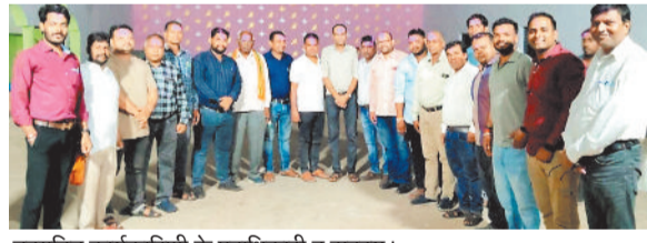
नवागठित कार्यकारिणी के पदाधिकारी व सदस्य।

क्षत्रिय राठौर समाज ग्रामीण इकाई जिला की बैठक ओम पैलेस हरदीबाजार में किया गया। जिसमें समाज के वरिष्ठ वरिष्ठजनों की