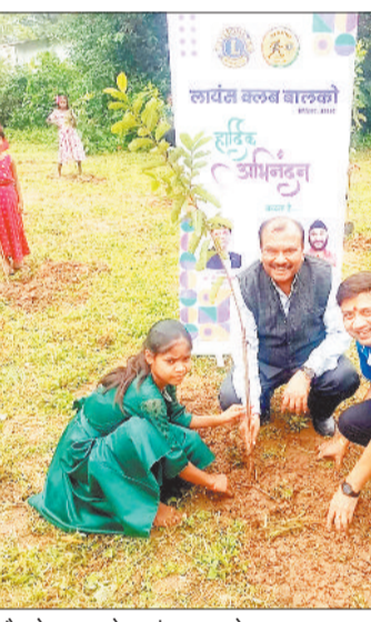
पौधरोपण करते लायंस क्लब के सदस्य।