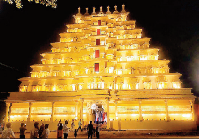
कटघोरा में निर्मित पद्मानाभस्वामी मंदिर की प्रतिकृति।

समिति की ओर से प्रतिवर्ष विशाल गणेश प्रतिमा स्थापित की जाती है। इस बार भी 111 फीट ऊंचा केरल का पद्मानाभस्वामी का आकर्षक पंडाल, 21 फीट ऊंचे गणेश जी का भव्य स्वरूप श्रद्धालुओं के बीच आकर्षण का केंद्र बना हुआ है। गणेश प्रतिमा के साथ ही हनुमान जी की जीवंत प्रतिमा और अन्य धार्मिक झांकियां भी लोगों को अपनी ओर खींच रही हैं। खासकर युवा और बच्चे यहां पर सेल्फी लेते हुए नजर आते हैं। भव्य पंडाल का निर्माण कोलकाता से आए कारीगरों ने एक माह से भी अधिक समय तक दिन-रात मेहनत कर तैयार किया है। प्रतिमा व झांकियों का निर्माण राजनांदगांव जिले के धनौद नगम स्थित राधे आर्ट गैलरी में हुआ है। समिति की परंपरा है कि हर साल अलग थीम पर पंडाल का निर्माण किया जाता है, “कटघोरा का राजा” को देखने कोरबा जिले के अलावा जांजगीर चांपा, बिलासपुर, अम्बिकापुर,सूरजपुर, रायगढ़, शक्ति, कोरिया के लोग बड़ी संख्या में