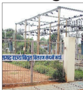
अंधार रातों विद्युत वितरण कर्मी मंच।

जिले के सुदूर वनांचल क्षेत्र में जो हाथी प्रभावित क्षेत्र है हाथी की धमक देते ही पूरी रात सुरक्षा की दृष्टि से बिजली को बंद कर दी जाती है लेकिन वहीं दूसरी ओर सुबह होने