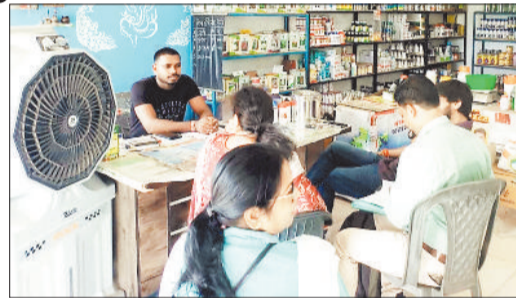
दुकानों का निरीक्षण कर कार्यवाही करते अधिकारी।

कलेक्टर अजीत वसंत के निर्देश पर कार्यालय उप संचालक कृषि कोरबा के जिला स्तरीय टीम द्वारा दुकानों में छापेमारी सतत की जा रही है। सोमवार को कृषि विभाग की टीम द्वारा जिले के खाद दुकानों का निरीक्षण किया। श्याम खाद भण्डार उरगा तथा सोनरक्षा कृषि केंद्र कुदुरमाल में खाद विक्रय का निरीक्षण में पाया गया कि उक्त दुकानों में वर्तमान स्थिति में खाद का भण्डारण निरंक है। पटेल कृषि केंद्र में कीटनाशक दवाओं का निरीक्षण किया गया। उप संचालक कृषि ने बताया कि पिछले वर्ष इसी अवधि के दौरान 6298.46 मेट्रिक टन यूरिया का वितरण किया गया था जबकि इस वर्ष 2025-26 में 6494.625 मेट्रिक टन यूरिया का वितरण किया जा चुका है। वर्ष 2025-26 में कुल खाद भण्डारण का लक्ष्य 20637 मेट्रिक टन था जिसके विरुद्ध