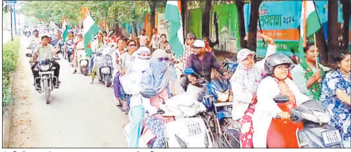
रैली निकालते एनएचएम स्वास्थ्य कर्मचारी।