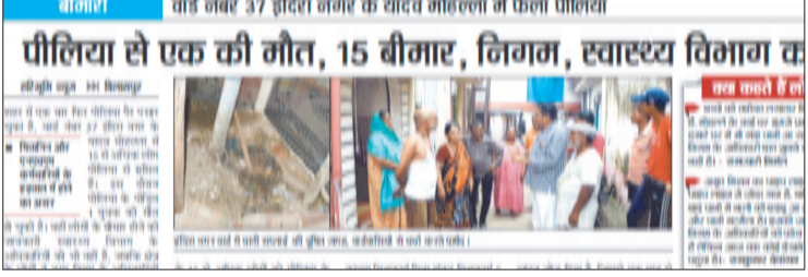
1 सितंबर को हरिभूमि में प्रकाशित खबर।

■ मितानिन और डाक्टरों का दल पहुंचा था इंदिरा नगर। इंदिरा नगर वार्ड में पीलिया फैलने की खबर से स्वास्थ्य विभाग में हड़कंप मच गया है। सोमवार को प्रभावित क्षेत्र का दौरा किया गया। सर्वे और शिविर के माध्यम से स्वास्थ्य विभाग ने स्थिति को संभालने के लिए डाक्टरों की टीम लगाई। इस दौरान शहरीय मितानिनों ने वार्ड के अलग-अलग गलियों में पानी का सैपल और सर्वे करने की जिम्मेदारी दी गई। टीम द्वारा 5 जगहों के पानी के सैपल लिया गया है। वहीं इस दौरान एक भी नया पीलिया से ग्रसित मरीज नहीं मिला है, वहीं 38 घरों का सर्वे कर 43 लोगों